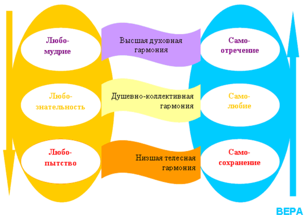
Рис. 9. Гармония форм веры и любви

«Из кувшина можно вылить только то, что было в нем» 1 ... самая низкая гармония лучше «самой высокой дисгармонии».